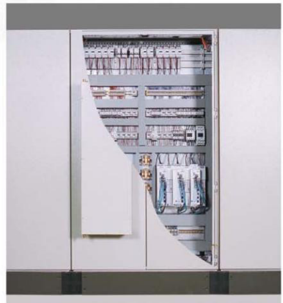
Übersichtlich strukturierter Schaltanlagenaufbau unter Berücksichtigung der entsprechenden EMV- und Sicherheitsrichtlinien