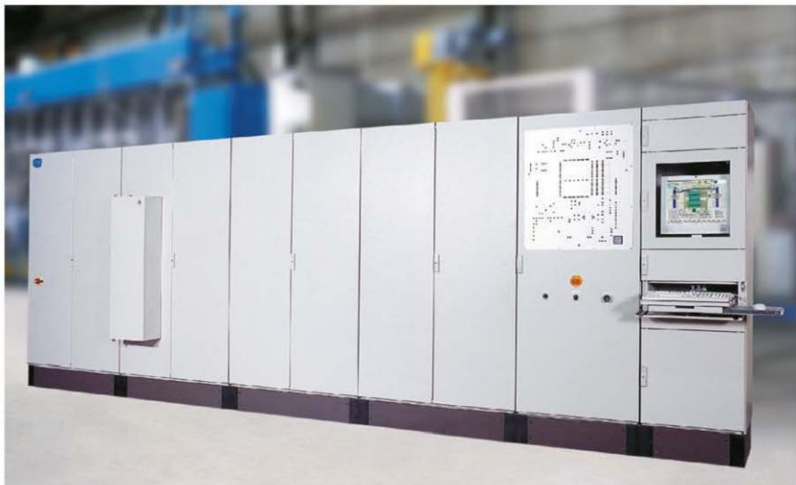
Schaltanlage mit Prozessleitsystem für brennstoffbeheizten Mehrrohrdurchstoßofen

● Steuer- und Regelanlagen im Verbund mit vor- und nachgeschalteten Produktionsmitteln