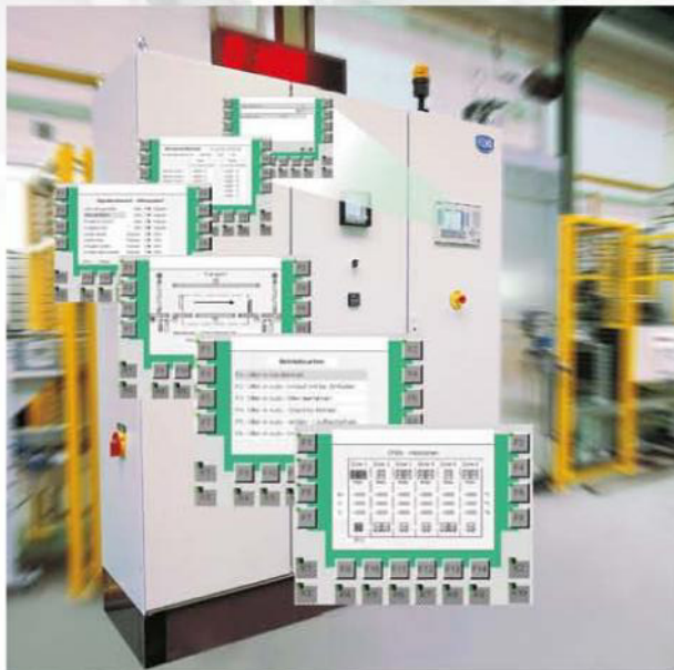
Schaltschrank mit Operatorpanel und durchgängig selbsterklärenden Bedienoberflächen

Qualitätssicherung durch Prozessanalyse, Datensicherung und Langzeitarchivierung